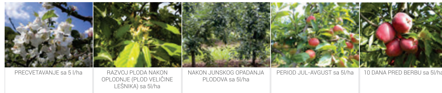
PRECVETAVANJE sa 5 l/ha

Slavol VVL se koristi folijarno 5 l/ha u fenofazama.