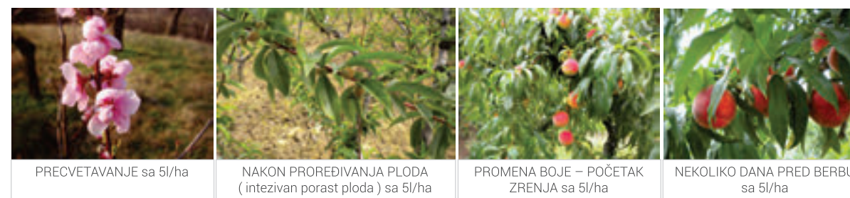
PRECVETAVANJE sa 5l/ha

Slavol VVL se koristi folijarno 5 l/ha u fenofazama