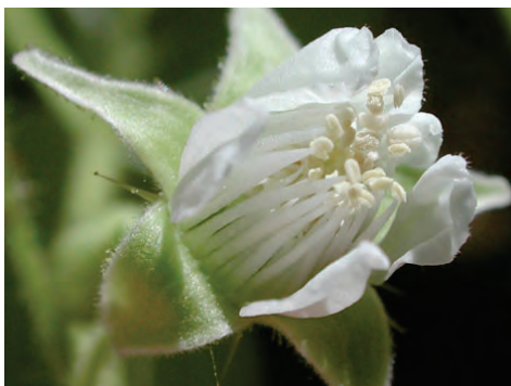
NA POČETKU I TOKOM CVETANJA