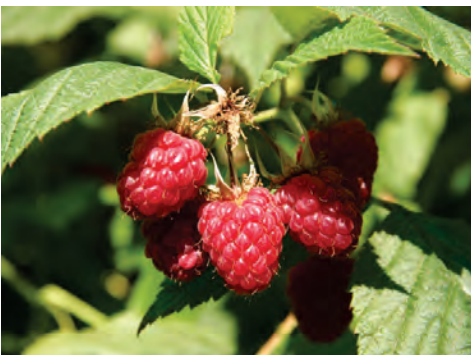
PRED SAMU BERBU