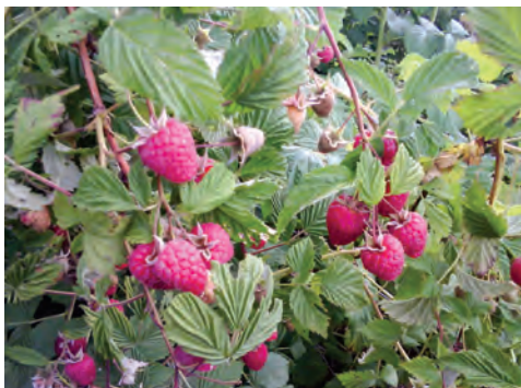
PRED BERBU 15 DANA